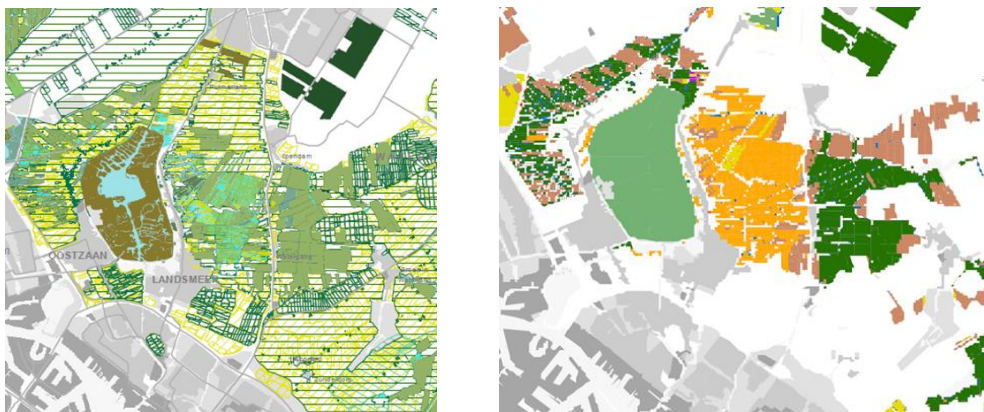
Figuur 2. Uitsnede Natuurbeheerplan (links) en overzicht beheerders (rechts) IJperveld

Aangezien de provincie Noord-Holland een belangrijk gebied is voor weidevogels, wordt het veenweidegebied rond IJperveld nader onderzocht. Het IJperveld is een natuurgebied dat eigendom is van de stichting Landschap Noord-Holland. Het behoort tot de gemeente Landsmeer en strekt zich uit tot Den IJp, IJpendam en Watergang. Het is een veenweidegebied, opgebouwd uit enkele meters dik drassig veen, waarop voornamelijk gras, riet en veenmos groeit en her en der moerasbos. De gearceerde delen op het linkerkaartbeeld geven de agrarische beheertypen in het gebied weer volgens het Natuurbeheerplan. Het rechterkaartbeeld geeft de soort beheerder aan. De oranje percelen worden beheerd door Landschap Noord-Holland, de donkergroene percelen door Staatsbosbeheer en de bruine percelen door particulieren.