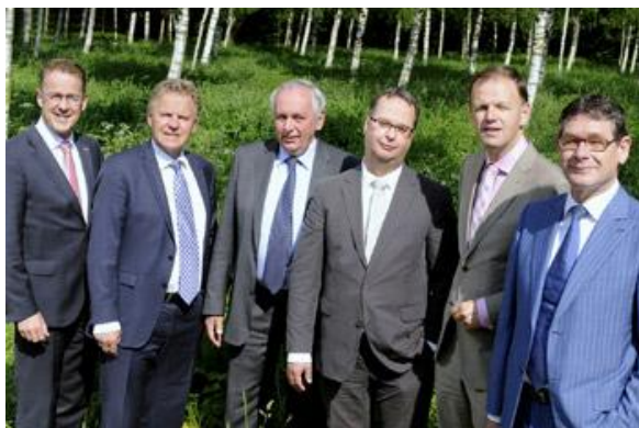
De Stuurgroep Groene hart is verantwoordelijk voor het Groene hartbeleid