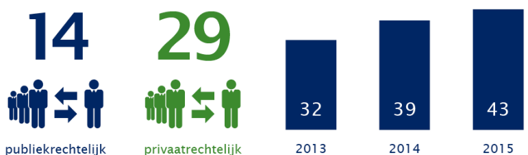
Aantal verbonden partijen in 2015