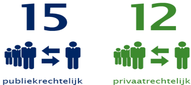
Aantal verbonden partijen in 2015