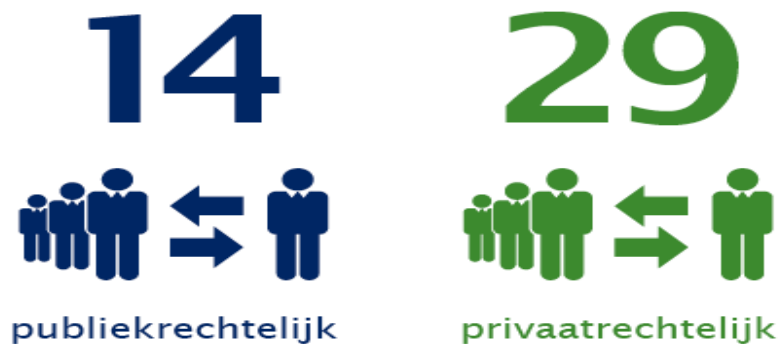
Aantal verbonden partijen in 2015