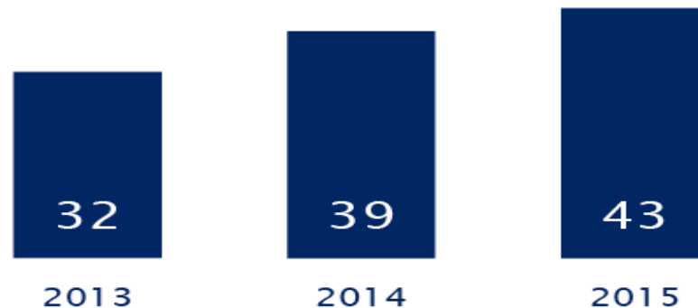
Ontwikkeling aantal verbonden partijen