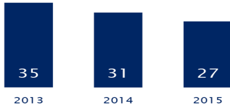
Ontwikkeling aantal verbonden partijen