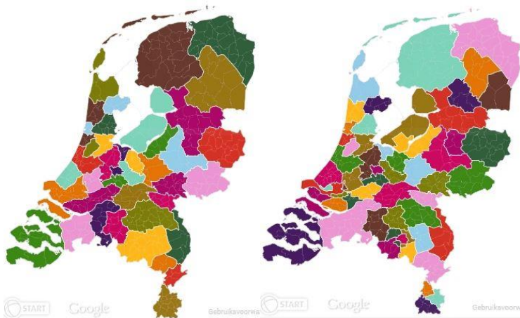
Figuur 1 Jeugdzorgregio's en regio's Herziening Langdurige Zorg.

De toegenomen omvang van samenwerkingsverbanden staat in de belangstelling. Hieronder (Figuur 2) zijn enkele koppen opgenomen van recent gepubliceerde artikelen: