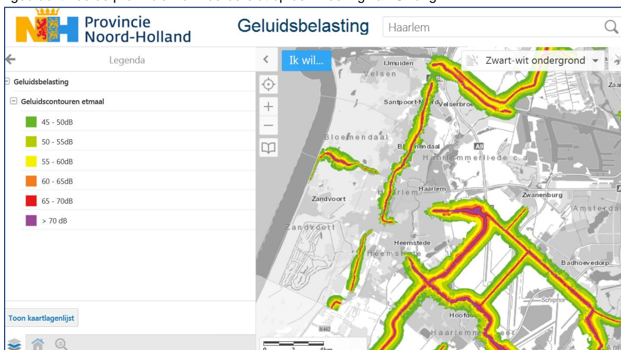
Deel geluidbelastingkaart 2012 provincie Noord-Holland

Geluidhinder heeft nadelige effecten op de gezondheid en het welzijn van mensen. De provincie is verantwoordelijk voor het beperken van geluidhinder afkomstig van verkeer op provinciale wegen. De provincie kan voor een belangrijk deel zelf bepalen in welke mate zij deze vorm van hinder beperkt. De maatregelen hiertegen worden opgenomen in een Actieplan dat iedere vijf jaar opnieuw wordt opgesteld en vastgesteld. Het Actieplan is gebaseerd op een geluidbelastingkaart die inzichtelijk maakt op welke locaties de meeste hinder is. In de nabije toekomst zal de belangrijkste wetswijziging op het gebied van geluid in 30 jaar bij de provincie worden ingevoerd, genaamd Swung-2 (Samen Werken aan de Uitvoering van Nieuw Geluidbeleid). Dit onderzoek biedt inzicht in het geluidhinderbeleid van de provincie en de uitvoering daarvan. Daarnaast is met dit onderzoek in beeld gebracht hoe de provincie zich voorbereidt op de invoering van Swung-2.