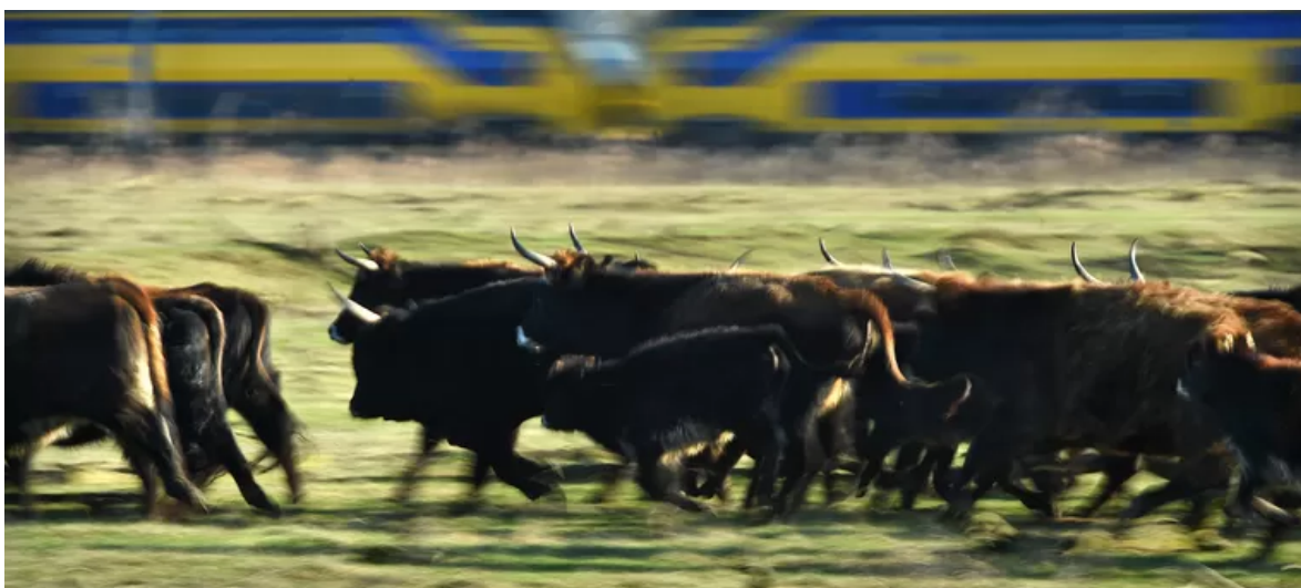
Heckrunderen bij de Oostvaardersplassen.